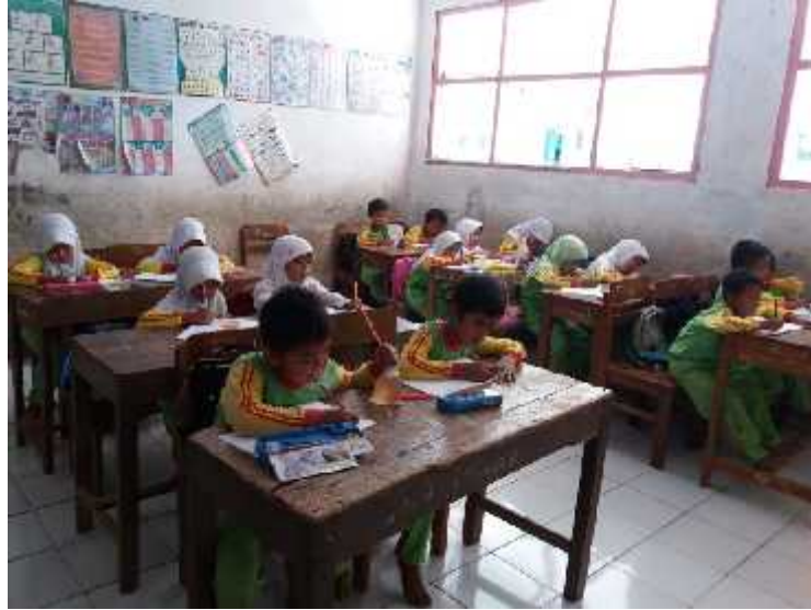
Gambar. 5. Siswa sedang mengerjakan soal Posttest