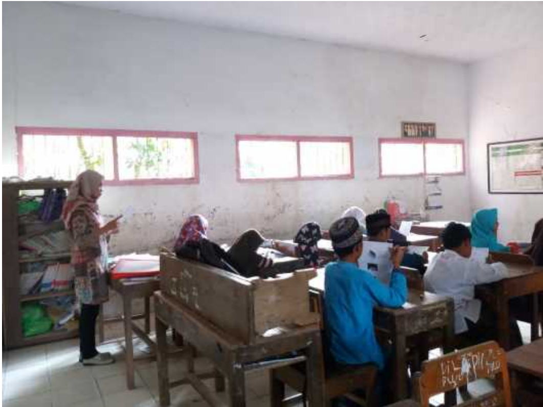
Gambar. 2. Observasi Aktivitas Siswa