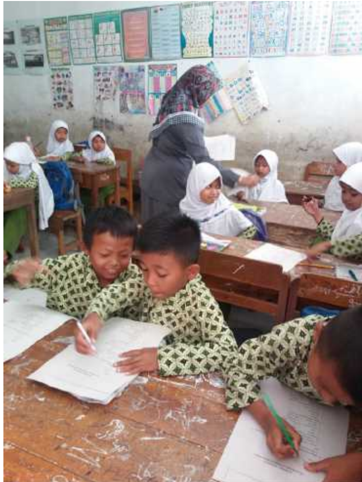
Gambar 1. Siswa sedang mengerjakan soal Pretest