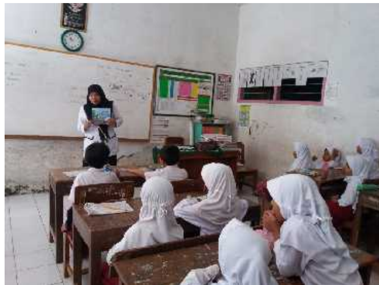
Gambar 3. Guru sedang menjelaskan materi Bahasa Indonesia tentang Keterampilan Membaca Pemahaman dengan Buku Cerita Bergambar