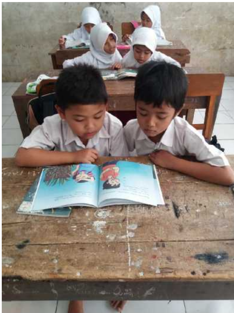
Gambar. 4. Penerapan buku cerita bergambar pada pembelajaran