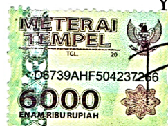
Firda Umamy NIM. 4041601